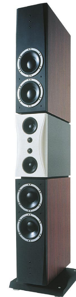
● Prisen for verdens bedste højtalere er 580.000 kr. for et sæt. Men priserne starter ved ca. 4.600 kr. ● The price of the best loudspeaker in the world is DKK 580,000 per set, but prices start at approx. DKK 4,600. ● Der Preis für den weltbesten Lautsprecher beträgt DKK 580.000 pro Set. Die Preise für die anderen Produkte beginnen jedoch schon bei etwa DKK 4.600.

Die Fabrik wurde 1976 gegründet, weil es damals keine Lautsprechereinheiten von ausreichend hoher Qualität gab. Lange Jahre lieferte Dynaudio Einheiten für Amateure, die darauf brannten, ihre eigenen Lautsprecher zu konstruieren. Heute ist die Nachfrage nach Dynaudios fertigen Lautsprechersystemen so groß, dass der Do-It-Yourself-Markt nicht länger bedient wird. Stattdessen haben die weltweit führenden Automobilhersteller ein besonderes Interesse, die Klangqualitäten in ihren Produkten zu verbessern – nachdem Dynaudio mit seiner Lösung für das Sportcoupé und das Cabriolet C70 von Volvo neue Maßstäbe gesetzt hat. Heute liefert Dynaudio für verschiedene Volvo und VW Modelle – sogar mit Co-Branding – und der Automobilmarkt gewinnt zunehmend an Bedeutung. Gerade im Hinblick auf die Automobilbranche hat Dynaudio folgende BVQI Zertifizierungen erhalten: QS/TS16949 (Qualität), was als übergeordnetes Regelwerk der Autoindustrie ISO 9001 und ISO 14001 (Umwelt) einschließt.