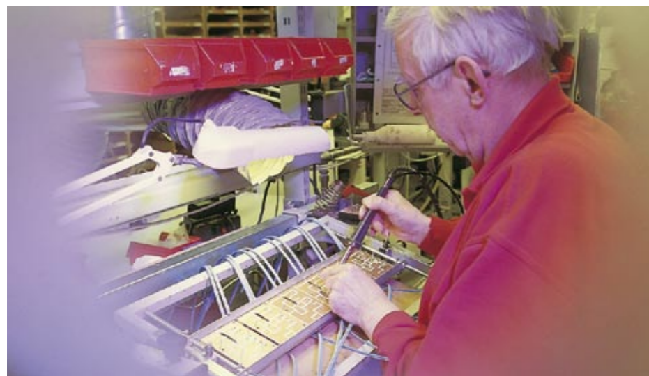
● Højtalere fra Danmark har et godt ry i udlandet. Men Dynaudio er uden diskussion det fornemste mærke. ● Loudspeakers from Denmark enjoy a good reputation around the world, but Dynaudio remains the most prestigious make. ● Lautsprecher aus Dänemark haben im Ausland einen guten Ruf. Dynaudio ist aber zweifelsohne die nobelste Marke.

Fabrikken blev grundlagt i 1976, netop fordi der på daværende tidspunkt ikke fandtes højtalereenheder af tilstrækkelig høj kvalitet. I adskillige år leverede Dynaudio enheder til amatører, der brændte for selv at konstruere egne højtalere. I dag er der så voldsom efterspørgsel efter Dynaudios færdige højtalersystemer, at D-I-Y markedet ikke længere forsynes. Til gengæld er verdens førende bilfabrikanter særdeles interesserede i at forbedre lyd kvaliteten i deres produkter – efter Dynaudio satte nye normer med sin løsning til Volvos sportscoupé og cabriolet C70 – så i dag leverer Dynaudio til adskillige Volvo og VW modeller – oven i købet med co-branding - og automotive markedet har fortsat større betydning. Netop med henblik på bilindustrien har Dynaudio opnået flg. BVQI certificeringer: QS/TS16949 (kvalitet) som er bilindustriens overbygning på ISO 9001 og ISO 14001 (miljø).