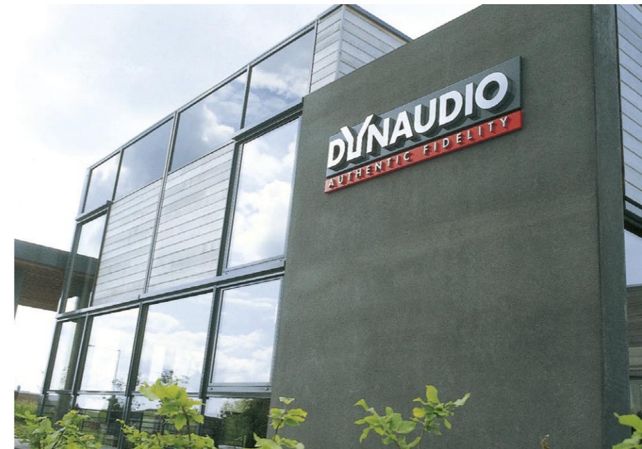
● Dynaudios nye hovedbygning er tegnet af arkitekt Jørgen Johansen MAA fra Arkitekter Johansen & Rasmussen. ● Dynaudio's new headquarters have been designed by Jørgen Johansen MAA of the firm of architects Johansen & Rasmussen. ● Das neue Hauptgebäude wurde von dem Architekten Jørgen Johansen MAA vom Architektenbüro Johansen & Rasmussen entworfen.

The factory was founded in 1976, simply because at that time loudspeaker units of a sufficiently high quality were not available. For several years Dynaudio supplied units to amateurs who were keen on building their own loudspeakers. Today the demand for Dynaudio's finished loudspeaker systems is so great that the company no longer produces for the DIY market. On the other hand, leading car manufacturers around the world are very keen to improve the sound quality in their products after Dynaudio set new standards with its solution for Volvo's C70 sports coupé and cabriolet, the result being that Dynaudio currently supplies loudspeakers for a range of Volvo and VW models – moreover with co-branding – and the automotive market remains important. It is primarily with a view to supplying the car industry that Dynaudio has acquired the follow-