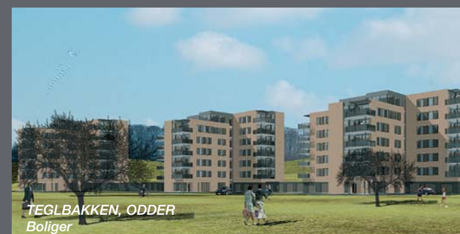
TEGLBAKKEN, ODDER Boliger