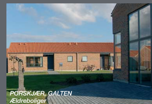
PORSKJÆR, GALTEN Ældreboliger