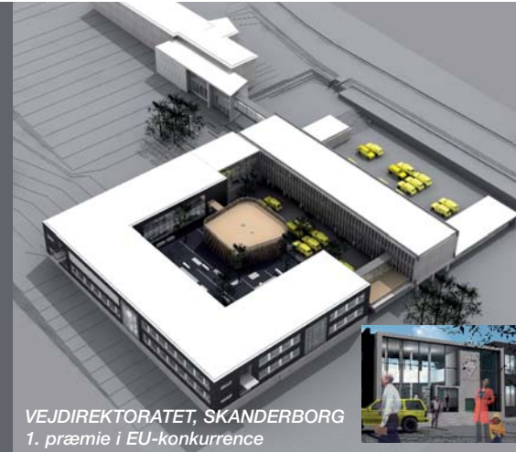
VEJDIREKTORATET, SKANDERBORG 1. præmie i EU-konkurrence