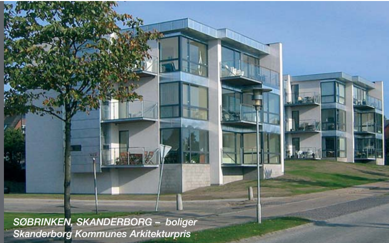
SØBRINKEN, SKANDERBORG – boliger Skanderborg Kommunes Arkitekturpris