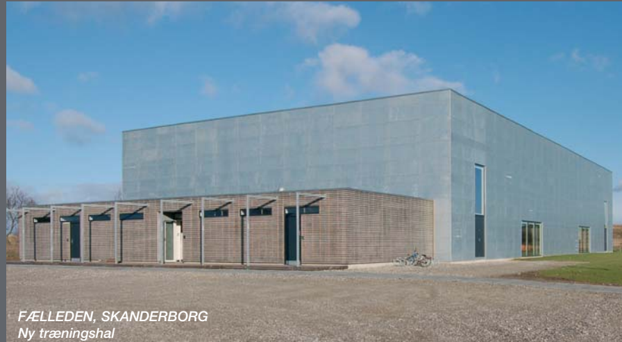
FÆLLEDEN, SKANDERBORG Ny træningshal