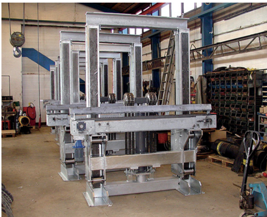
10 tons hydraulisk løfteanlæg med påbygget kædebaner til løft og transport af 13 meter lange emner, 2,8 meter over gulv. – Leveret til Dansk Overflade Teknik A/S.