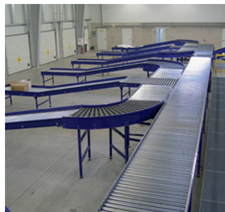
Pakkepost-terminal til sortering og transport af pakker. Leveret til Letland.

The company Masterroll A/S in Hørning specialises in the design, construction, manufacture and assembly of turnkey transport systems large and small for the internal transport assignments for all types of industries. The systems are made from stainless steel, powder-coated steel, hot-galvanized steel, electroplated steel and aluminium.