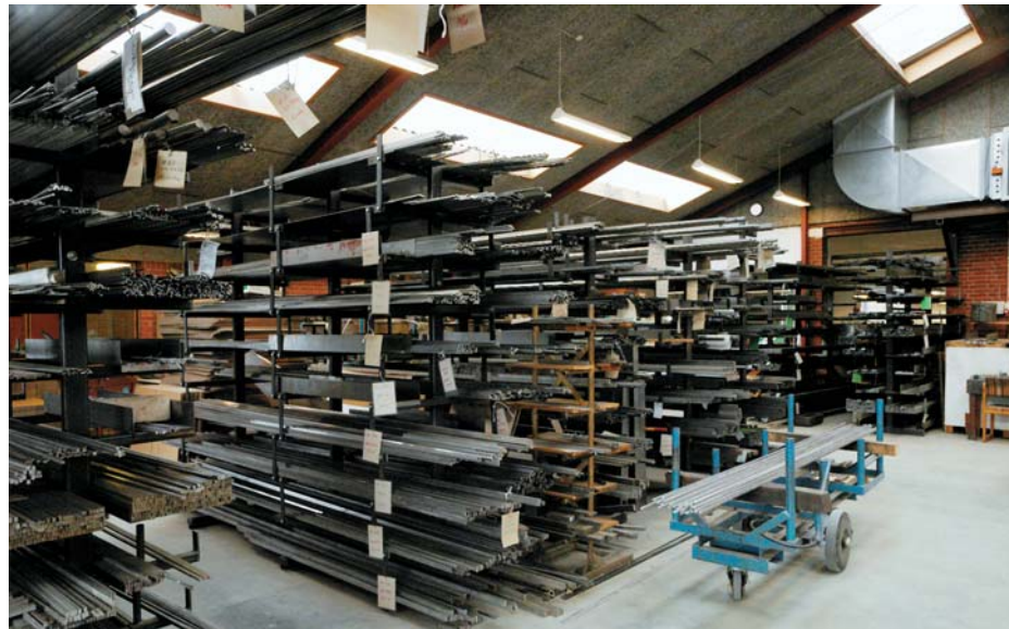
● Stort råvarerlager af kilestål og rustfrit stål ● Large stocks of key steel and stainless steel