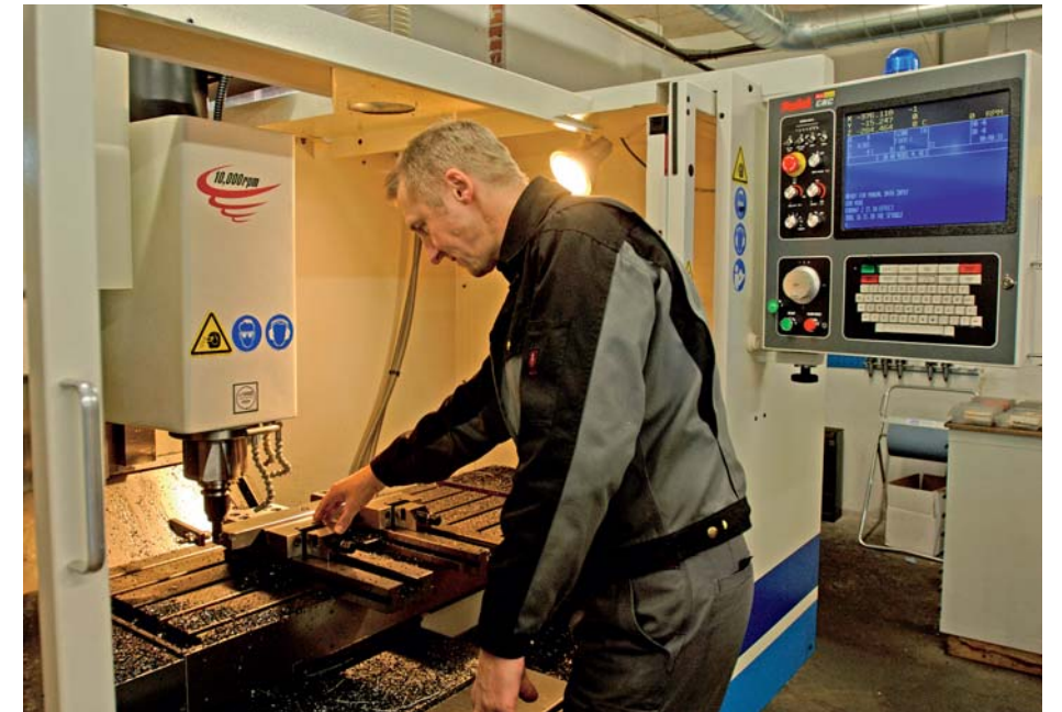
● CNC-styring og præcision ● CNC control and precision

However, the modern company which now occupies a total of 1,000 square metres, including a large